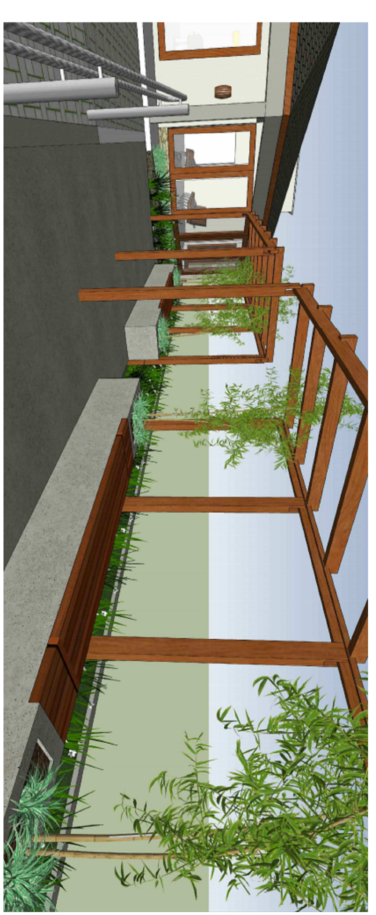
PERSPECTIVA 3D - ESTARES EXTERNO