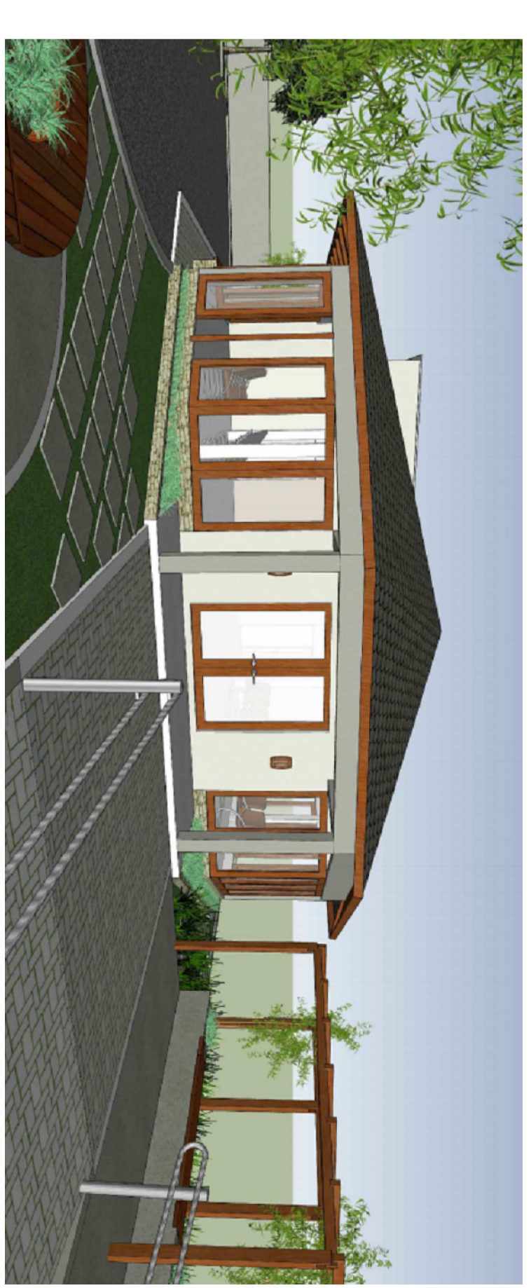
PERSPECTIVA 3D - FACHADA FRONTAL