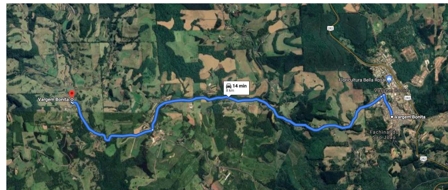
PLANTA DE SITUAÇÃO - COMUNIDADE LINHA CORAÇÃO