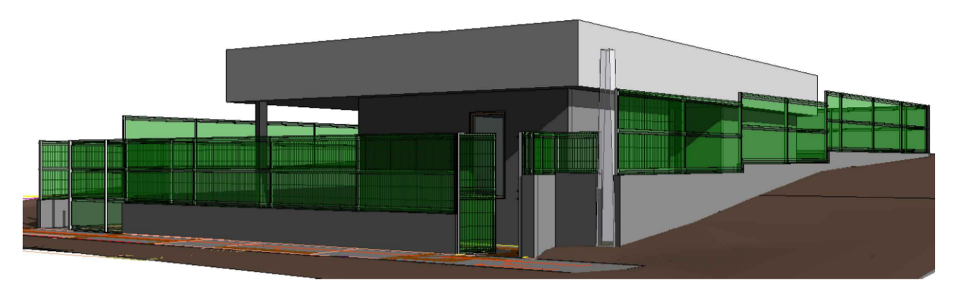
3 ISOMÉTRICA S/ ESC.