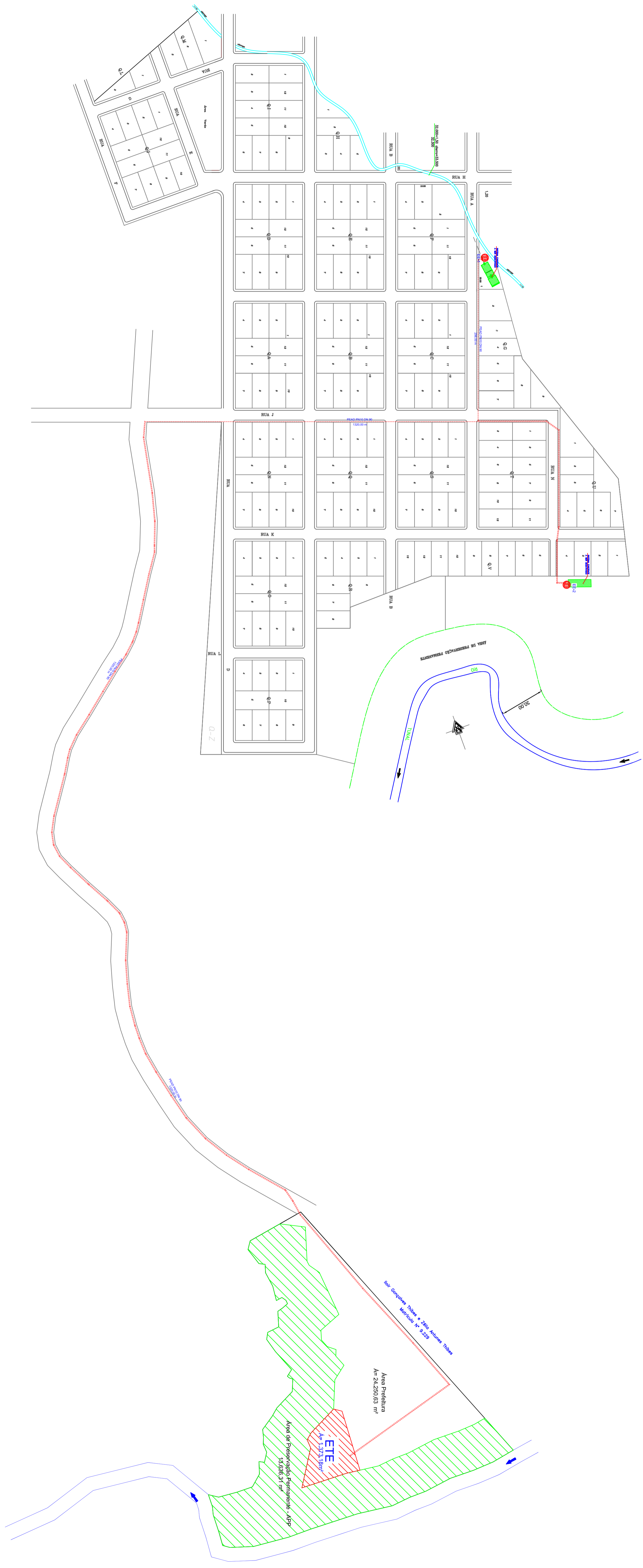
1 PLANTA GERAL - ESTAÇÕES ELEVATORIAS E LINHAS DE RECALQUE ESCALA 1:1500