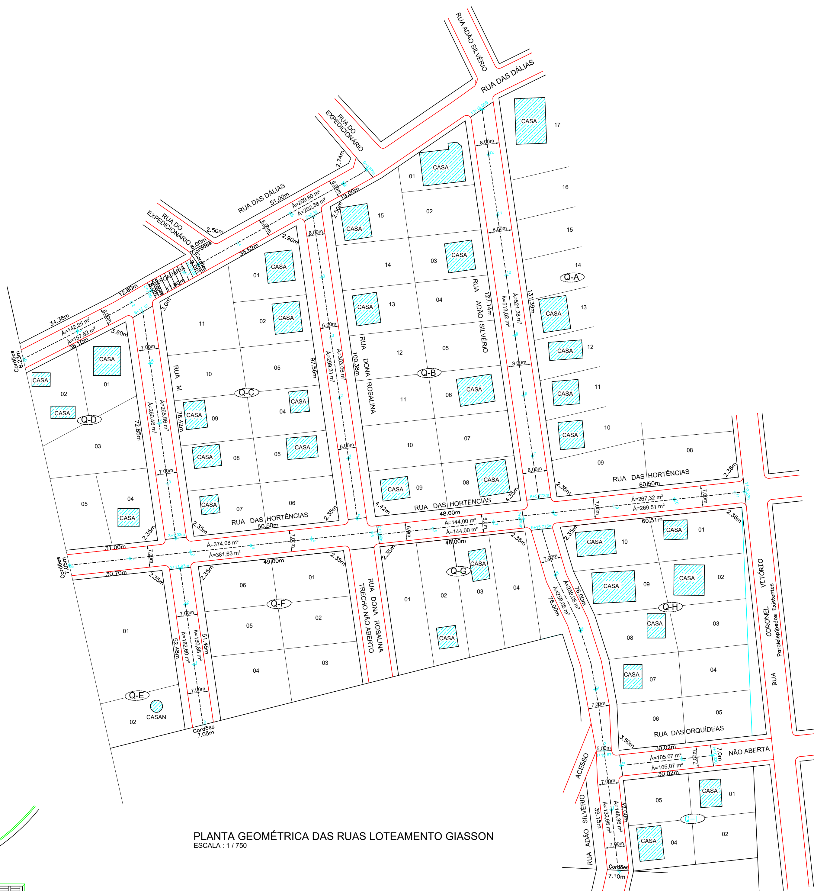
PLANTA GEOMÉTRICA DAS RUAS LOTEAMENTO GIASSON ESCALA: 1 / 750