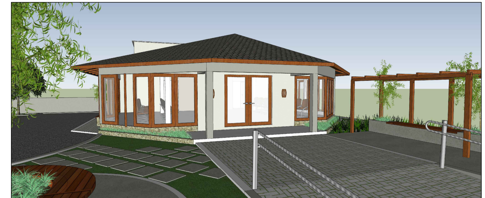
Imagem volumétrica - vista da fachada frontal