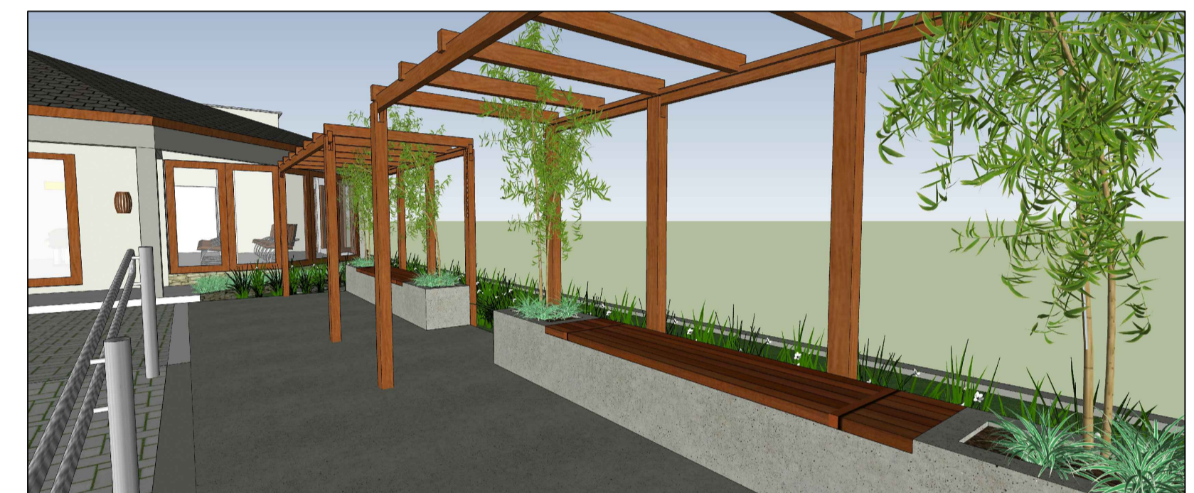
Imagem volumétrica - vista dos estares externos