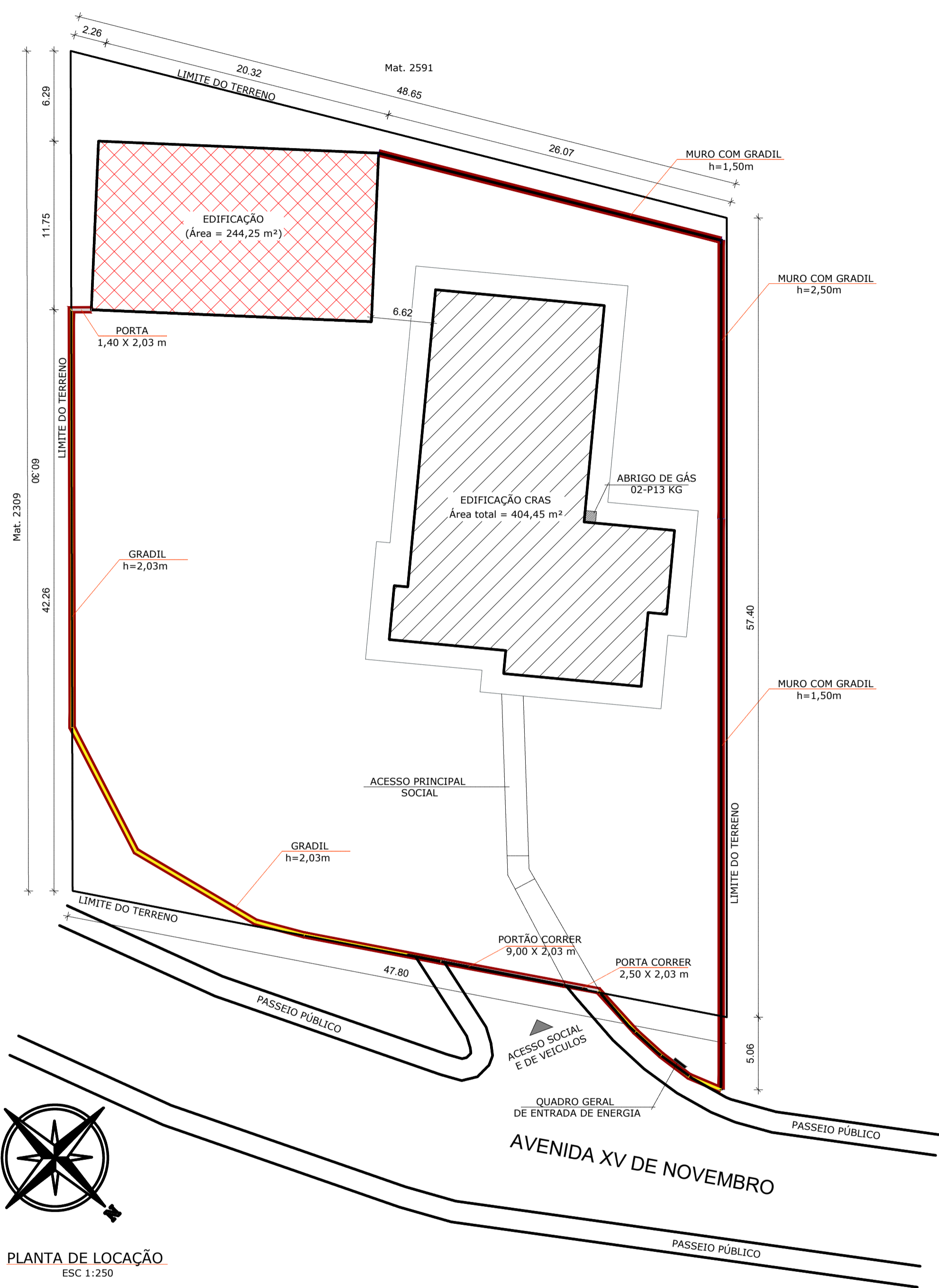
PLANTA DE LOCAÇÃO ESC 1:250