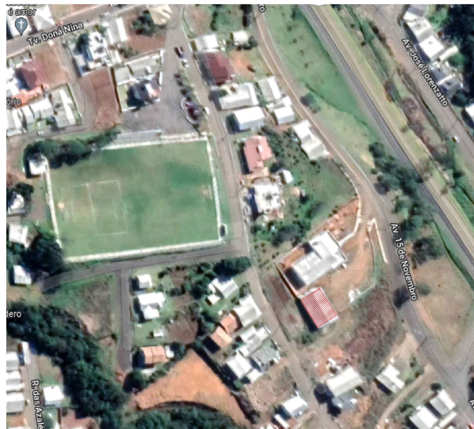
SITUAÇÃO Sem escala