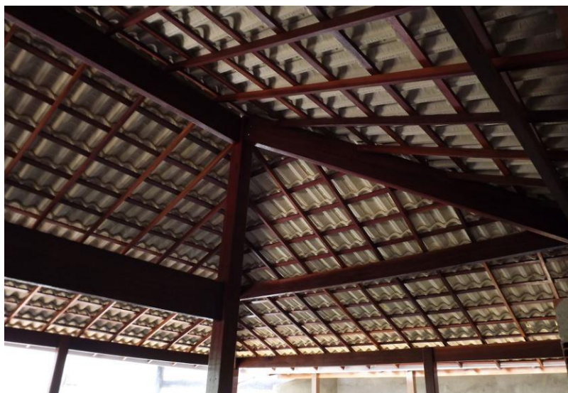
DETALHE ESTRUTURA METALICA (COR AMADEIRADO) E TELHAMENTO APARENTE

O assentamento das peças de cumeeira deverá ser feito com emboçamento. A argamassa a ser empregada no emboçamento das peças complementares (cumeeira, espigão, arremates e eventualmente rincão) precisa ter boa capacidade de retenção de água, ser impermeável, não ser muito rígida, ser insolúvel em água e apresentar boa aderência ao material cerâmico. Não poderão ser empregadas argamassas de cimento e areia, isto é, argamassa extremamente rígidas.