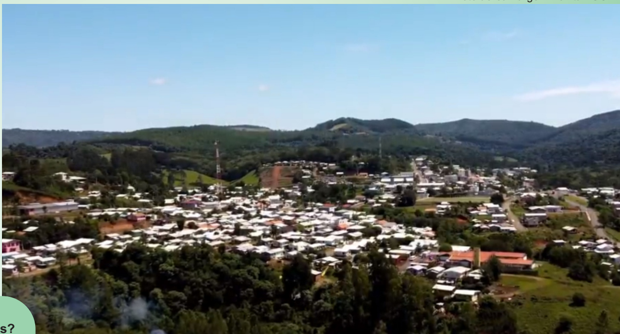
Foto aérea Vargem Bonita - SC.

A supressão de vegetação em APP somente poderá ser autorizada em caso de utilidade pública ou de interesse social, devidamente caracterizados e motivados em procedimento administrativo próprio, quando não existir alternativa técnica e de local ao empreendimento proposto.